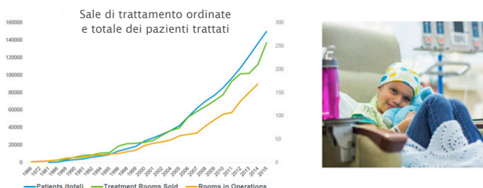
Numero osservato di sale PT in funzione, pazienti trattati con PT