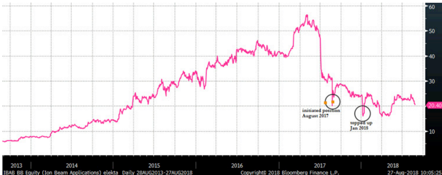
Diagramma dei prezzi delle azioni Ion Beam Applications dal 2013