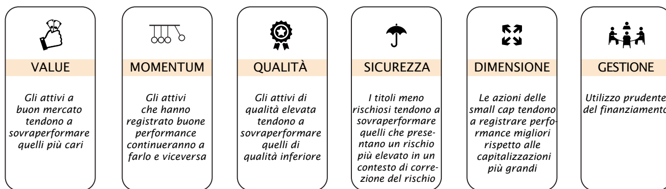
Figura 1: Elenco dei premi azionari

Questo è solo un esempio di come due premi che si comportano bene in scenari di mercato differenti possono, se combinati, generare un profilo di rendimento più stabile. Riteniamo che ampliando moderatamente il numero di premi di rischio sia possibile ottenere un risultato molto più soddisfacente. In definitiva, l'idea di fondo è che, combinando i premi, è possibile costruire un portafoglio con almeno un paio di motori di performance che funzionano in ogni scenario di mercato. È opportuno osservare che la combinazione di premi potrebbe causare complessità; pertanto, le strategie basate su più premi traggono ampio beneficio dalle competenze di gestione del rischio e disciplina proprie dei sistemi informatici sviluppati e amministrati da esperti quantitativi del mercato.