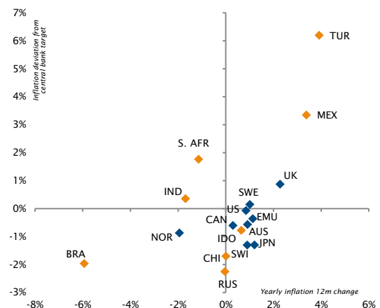
Quellen: Factset, Markit, SYZ Asset Management Stand der Daten 17. November 2017